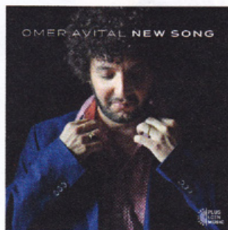
OMER AVITAL New Song Plus Loin Music

Mêlant musiques juives, évocations du Maghreb et des contrées du Moyen-Orient, le quintet réuni par Omer Avital, qui comprend un inattendu Avishai Cohen à la trompette, fête avec originalité et grande précision dans les arrangements des textures musicales soyeuses, souvent allègres, toujours empreintes d'une chaleur immédiatement proche faisant lever dans l'imagination des images que l'on aurait pu croire lointaines. Un mélange de parfaite décontraction et intensité de l'expression, liberté d'énonciation et rigueur de structure des exposés et improvisations, alliage enchanteur au service d'un voyage musical d'excellente compagnie.